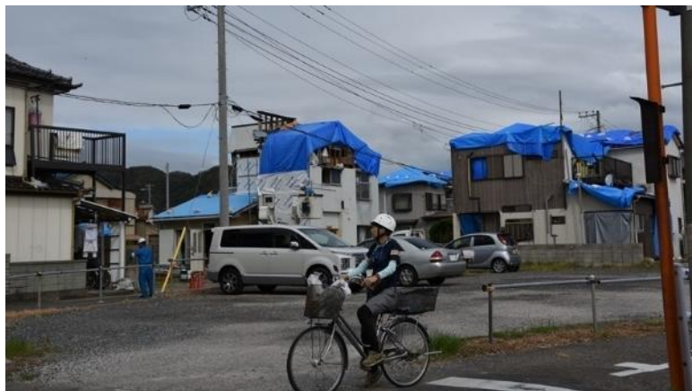
被害が大きい裾南町の住宅