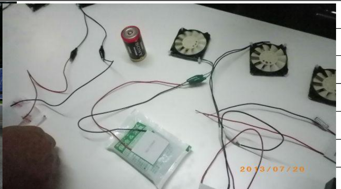
太陽光電池で遊ぶ(影の影響度合いを見る)