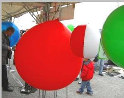
CO2量1キログラム入の風船