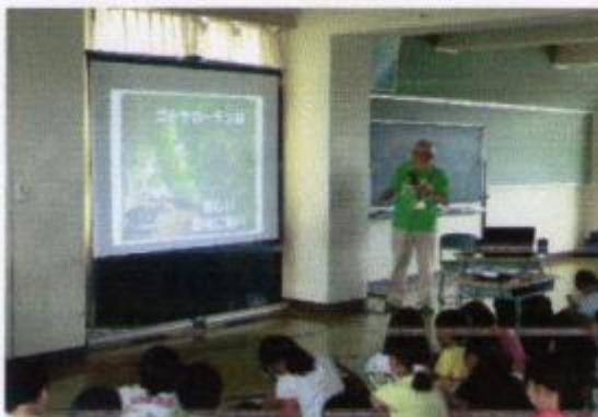
ゴーヤカーテンから環境を考えろ