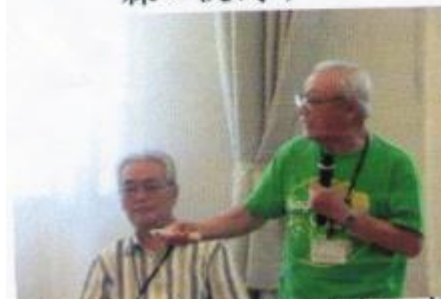
ーヤカーテンから環境を考える