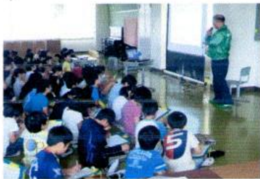
温暖化を止める流山の行動