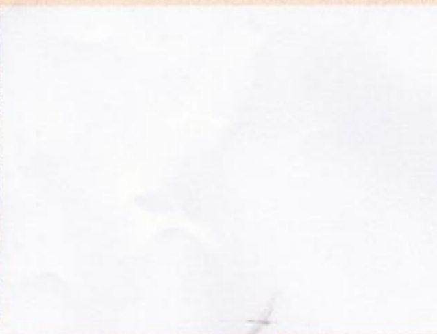
12) 西初石小学校のゴーヤカーテン写真 (8月12日撮影)