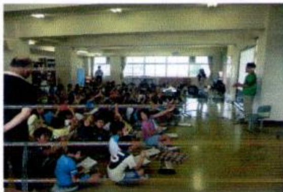
飯塚先生のまとめ