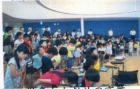
児童からお礼の言葉