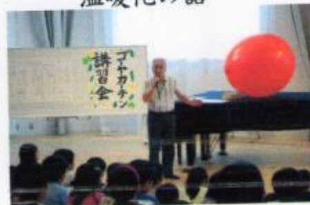
ゴーヤカーテンを元気に育てる工夫