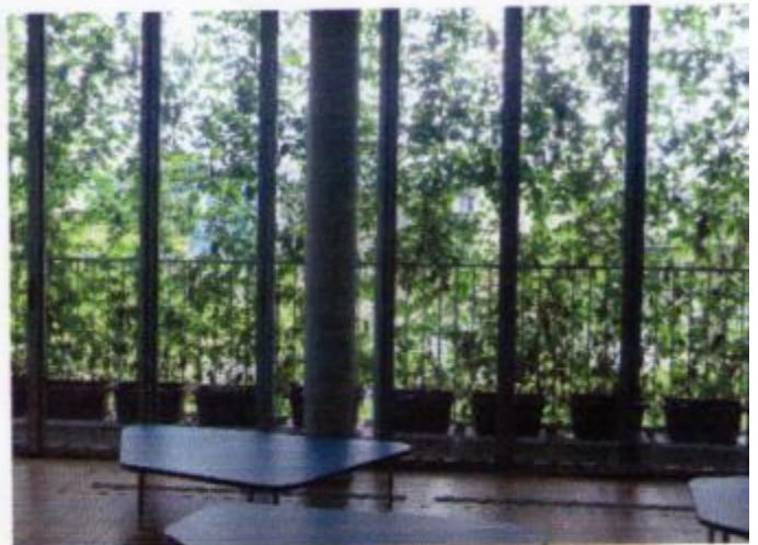
10) 小山小学校のゴーヤカーテン写真 (8月12日撮影)