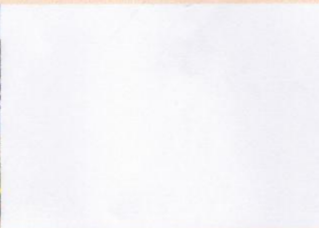
13) 新川小学校のゴーヤカーテン写真 (8月12日撮影)