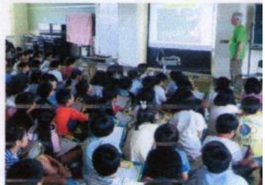
ゴーヤ苗定植後の育て方